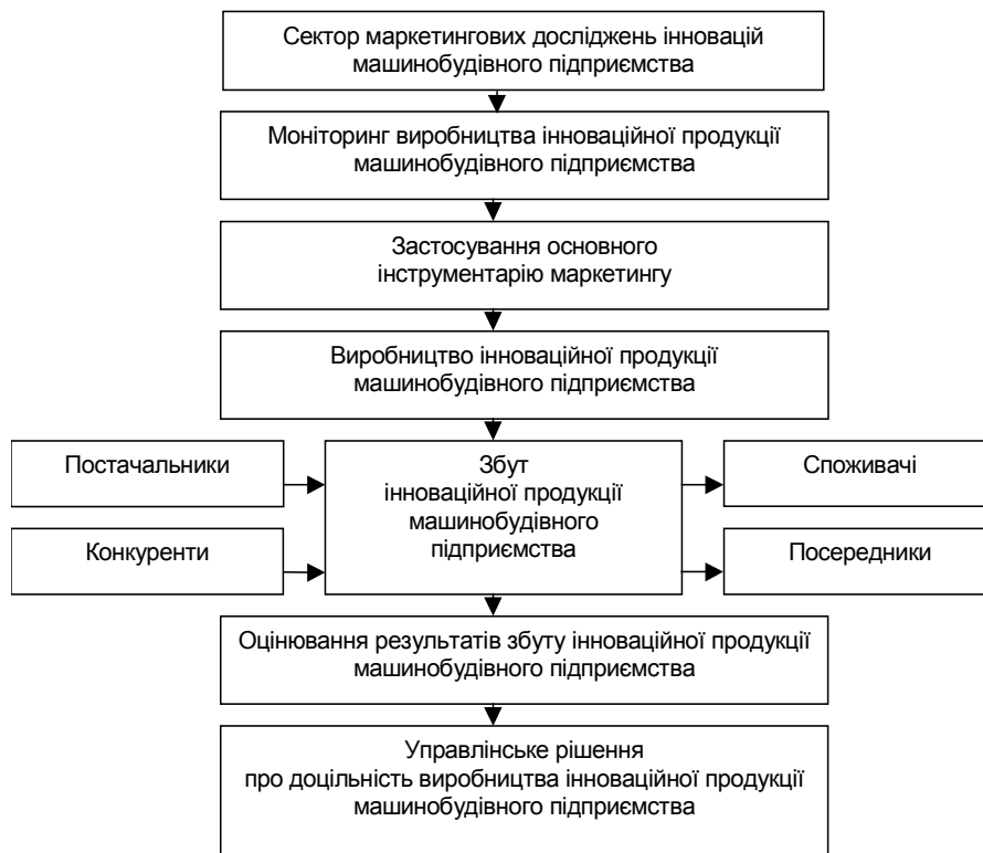
Рис. 3. Алгоритм інноваційного розвитку машинобудівного підприємства із застосуванням маркетингової концепції

Алгоритм інноваційного розвитку машинобудівного підприємства із застосуванням маркетингової концепції подано на рис. 3.