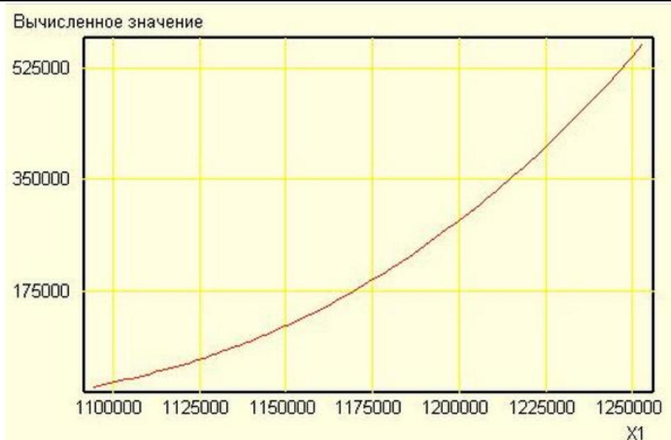
Рис. 2. Графік залежності між обсягом інвестицій в основний капітал та ВВП

Тепер змінимо значення показника інфляції. За прогнозами на кінець 2013 р. вона становитиме 10,5%, ВВП – 1253 млрд грн, депозити фізичних і юридичних осіб за-