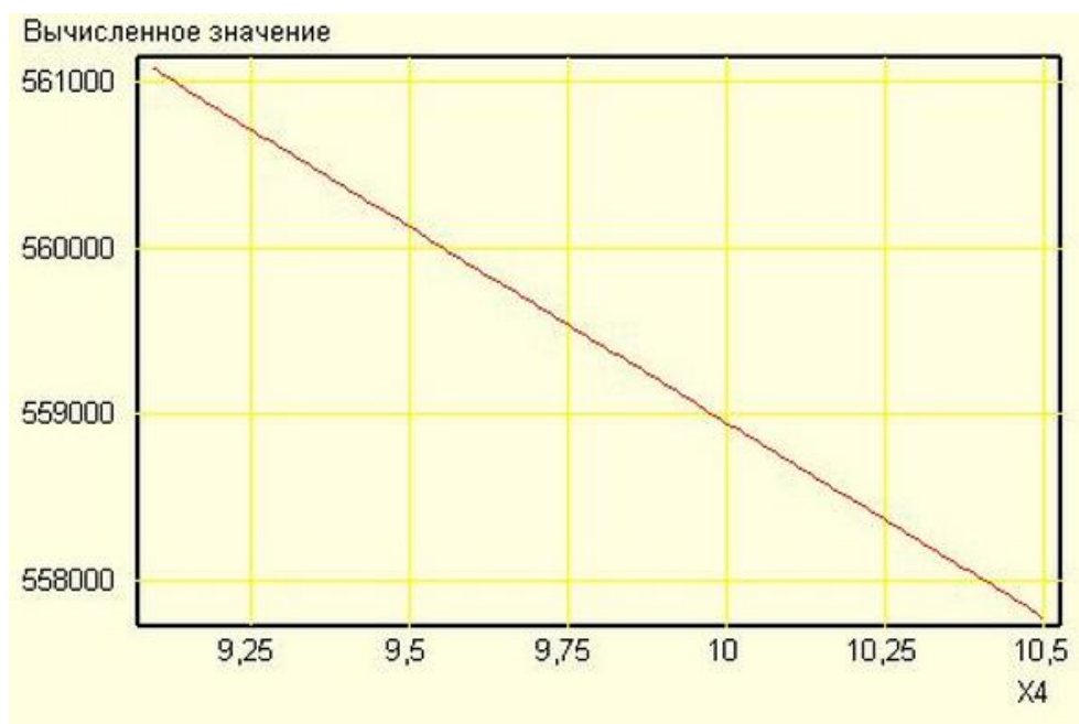
Рис. 3. Графік залежності між обсягом інвестицій в основний капітал та інфляцією

лишаються незмінними. За таких умов розрахункове значення інвестицій в основний капітал становитиме 557780 млн грн (рис. 3).