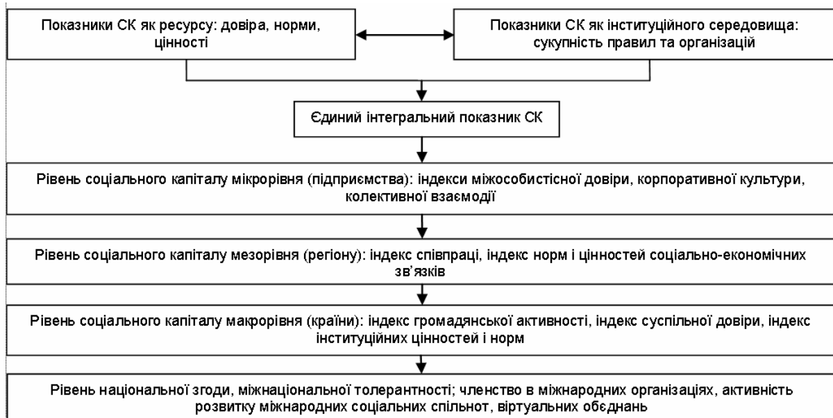
Рис. 2. Показники соціального капіталу на різних рівнях

Узагальнену схему показників, що характеризують соціальний капітал на різних рівнях, подано на рис. 2.