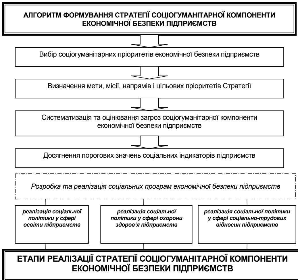
Рис. 2. Етапи формування та реалізації стратегії соціогуманітарної компоненти економічної безпеки підприємств

У сучасних посттрансформаційних умовах більш детально ми сформуваємо етапи формування та реалізації стратегії соціогуманітарної компоненти економічної безпеки підприємств (рис. 2).