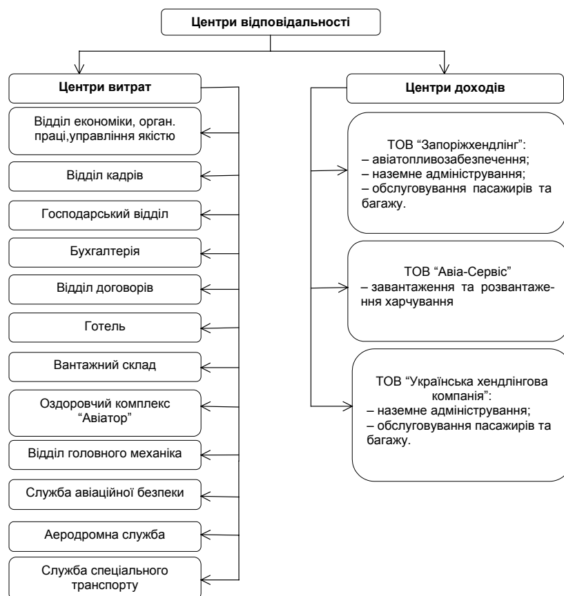
Рис. 1. Центри відповідальності доходів і витрат КП "Міжнародний аеропорт Запоріжжя"

Згідно з організаційною структурою управління комунальним підприємством "Міжнародний аеропорт Запоріжжя", складаємо схему центрів відповідальності доходів і витрат (рис. 1).