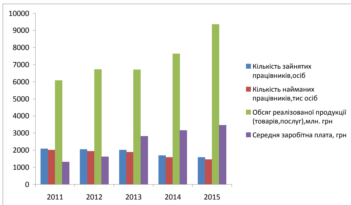
Рис. 2. Основні показники діяльності малих підприємств в Україні за 2011–2015 рр.

Наведені вище кількісні та графічні дані засвідчують за окремими показниками як негативну, так і позитивну тенденцію. Обсяги реалізованої продукції за період з 2011 по 2015 рр. зросли, а кількість зайнятих і найманих працівників скоротилася. В умовах стабільної економіки це засвідчувало би зростання продуктивності праці, однак