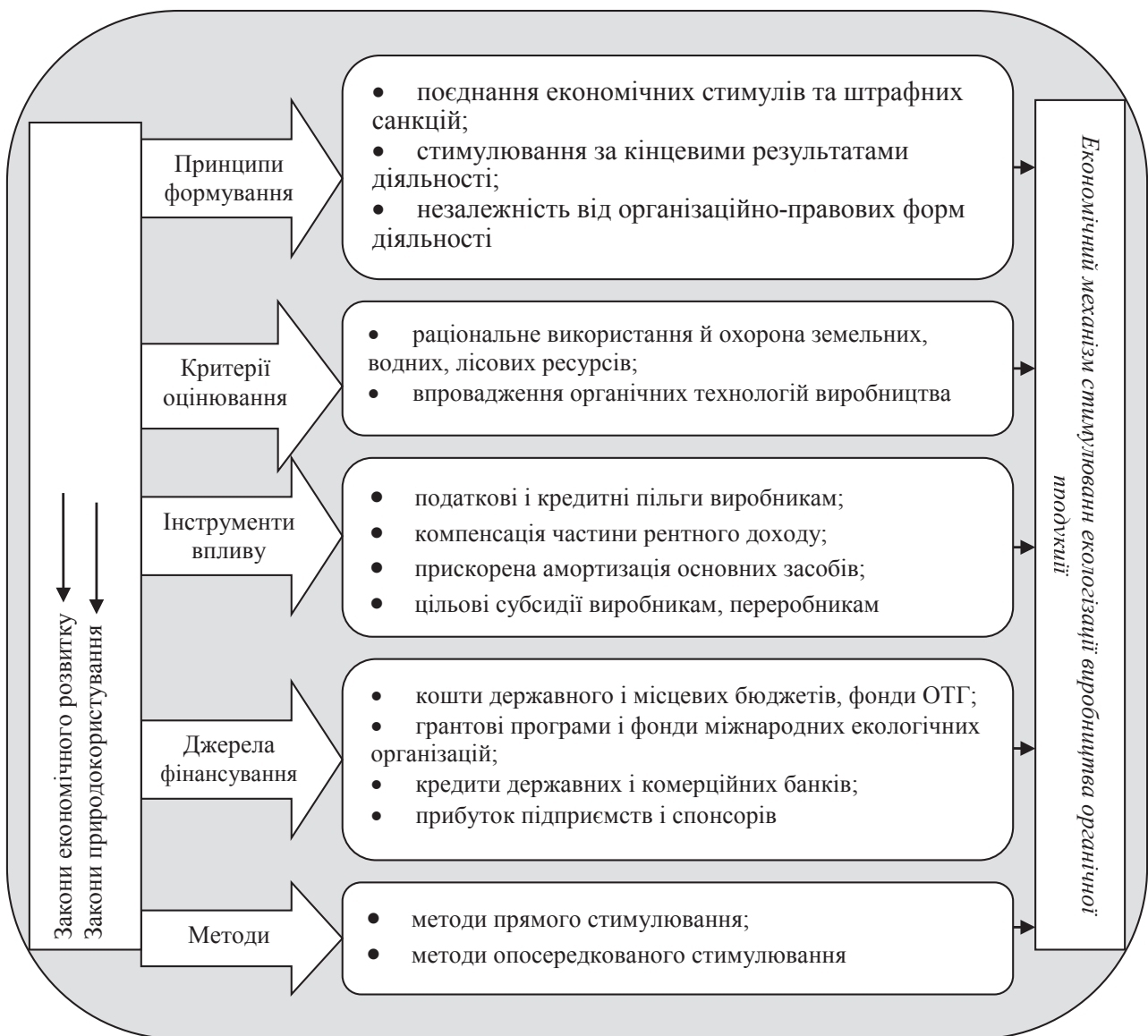
Рис. 2. Економічний механізм стимулювання екологізації аграрного виробництва

На основі проведених досліджень критерії згруповано у такі три блоки, як превентивні заходи; заходи з раціонального використання