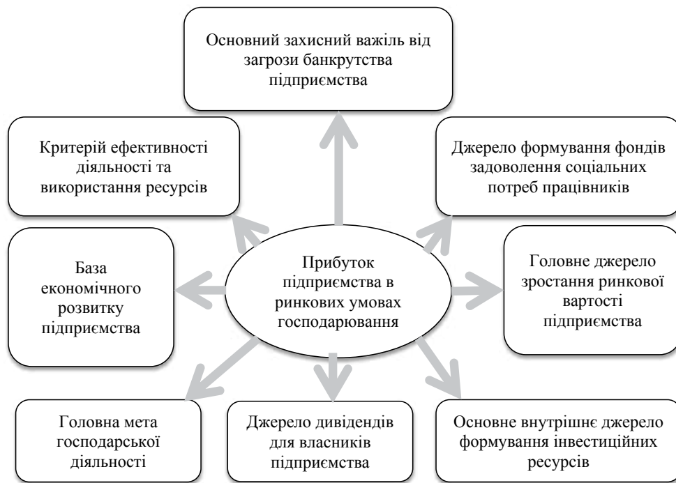
Рис. 1. Характеристика ролі прибутку для підприємств в умовах ринкової економіки України

Всі елементи процесу управління прибутком мають важливе значення. Однак серед них виділяється процес формування прибутку підприємства, який розглядається як отримання певного фінансового результату суб'єкта підприємницької діяльності, що здійснює господарську та іншу діяльність. Однак слід зважати на те, що прибуток як результат діяльності не є безпосереднім об'єктом управління. І фактичне досягнення його певної величини можливе через вплив на