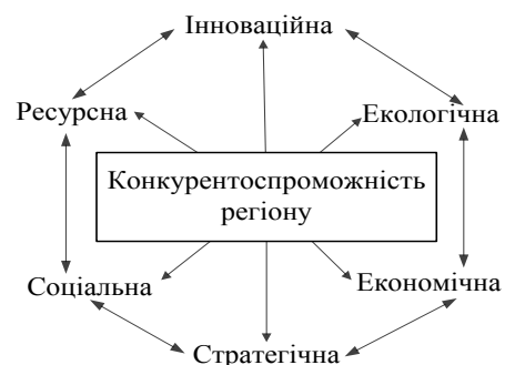
Рис. 2. Види конкурентоспроможності регіону

Ці характеристики впливають на конкурентоспроможність регіону, але важливо зазначити, що конкурентоспроможність регіону не є простою сумою конкурентоспроможностей складових архітектури регіональної економіки, хоча і будується на їх основі. Саме через розмаїття складників та їх зв'язків формуються різні види конкурентоспроможності, які взаємопов'язані та взаємовпливові (рис. 2).