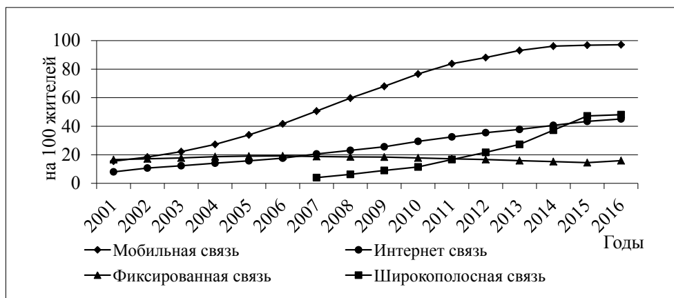
Рис. 1. Глобальные изменения плотности пользователей на 100 жителей в сфере ИКТ за 2001–2016 годы

Проанализируем динамику развития сферы связи и информатизации в период становления информационного общества в мире, так как, измеряя информационное общество, возможно отслеживать прогресс, обнаружить проблемы и пути по достижению устойчивого развития как отдельных предприятий, так и страны в целом. По данным Международного союза электросвязи [17], во всем мире плотность пользователей мобильной связи на 100 жителей достигает 96,8 чел. в конце 2015 года (рис. 1), что почти в три раза больше, чем в 2005 году. Темпы развития фиксированной связи в мире продолжают медленно расти – 4,4% на конец 2015 года, что происходит за счет замедления темпов роста проникновения в развивающихся странах. Почти 3 млрд. человек (40% населения земного шара) пользуются сетью Интернет. Уровень проникновения пользователей сети Интернет в мире на конец 2015 года составил 40%.