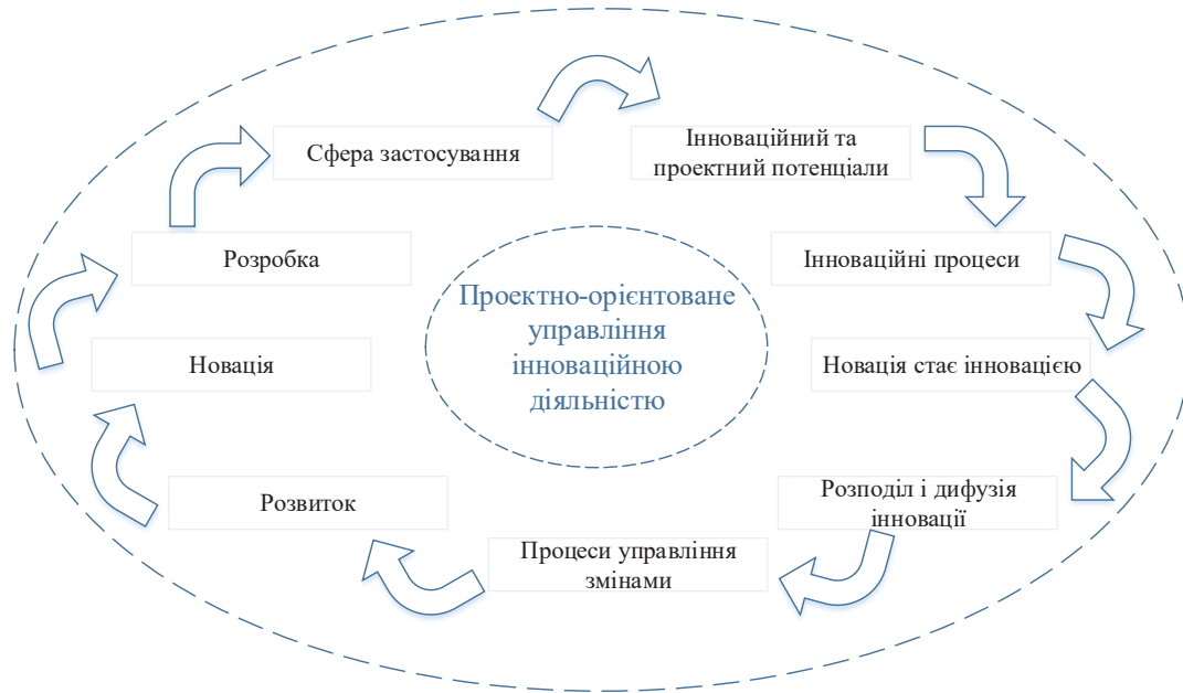
Рис. 2. Модель проектно-орієнтованого управління інноваційною діяльністю