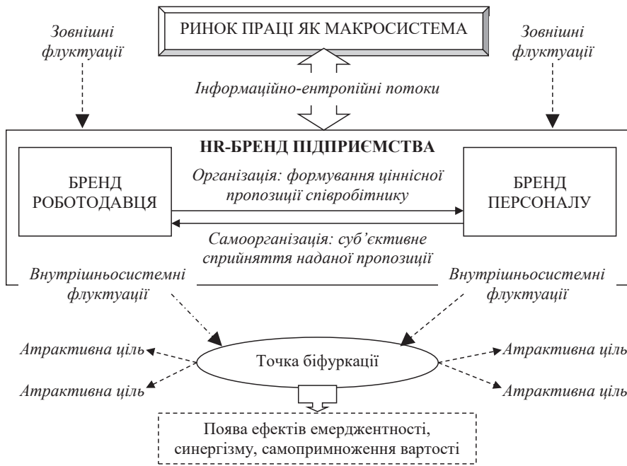
Рис. 1. Синергетичний контекст еволюції HR-бренду підприємства

З огляду на це, для підвищення ефективності HR-брендингу доцільно застосовувати синергетичне управління, що допомагає розпізнавати (або ініціювати) точки біфуркації, «гасити» небажані флуктуації, утримувати систему в рамках «ентропійного каридору», здійснювати інформаційний обмін із зовнішнім середовищем та виводити систему на оптимальний для неї атрактор, що є втіленням ідеального HR-бренду, аналогом стратегічної мети підприємства.