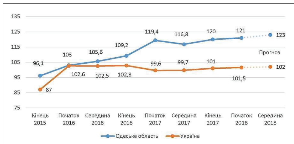
Рис. 1. Темп зростання промислового виробництва Одеської області та України за 2015–2018 рр., % [11]

Структуру зареєстрованих безробітних станом на 1 вересня 2019 р. наведено на рис. 2.