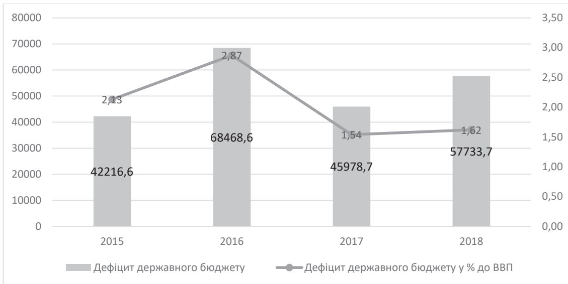
Рис. 1. Дефіцит державного бюджету в одиницях і % до ВВП

на дефіцит і становив 9 960,1 млн грн станом на 01.07.2018. Дослідження показують стрімке збільшення дефіциту бюджету у грудні порівняно з червнем 2018 р. на 47 773,6 млн грн, або на 82,75%.