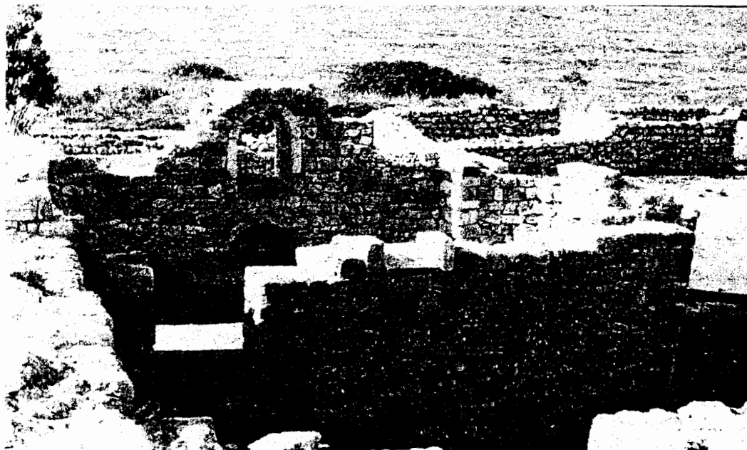
Рис. 2. Храм-часовня после частичной реставрации