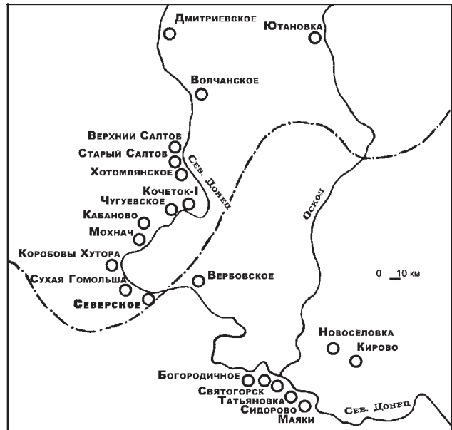
Рис. 4. Карта городищ салтовской культуры в бассейне верхнего и среднего течения Северского Донца

Исходя из вышеизложенного, считаем, что городище Северское (Меловое) необходимо исключить из круга древностей раннего железного века и ввести в перечень памятников салтово-маяцкой археологической культуры (рис. 4). Это будет способствовать правильному пониманию политической и этнокультурной ситуации как для скифского периода данного региона, так и для раннего средневековья. Время бытования рассмотренного городища определяется общими рамками существования салтовской культуры — середина VIII–середина X вв.