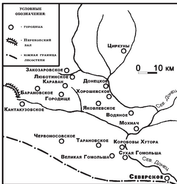
Рис. 2. Карта лесостепных городищ скифской эпохи в бассейне Северского Донца