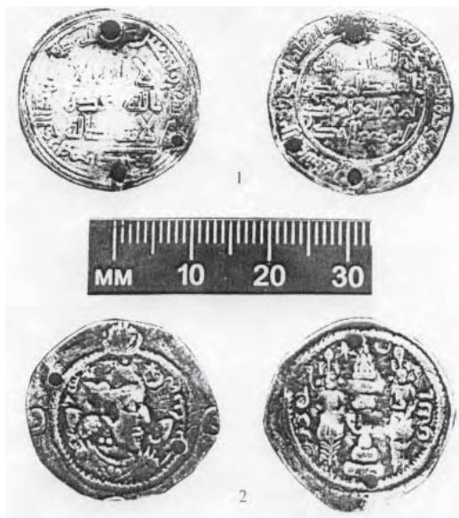
Рис. 3. Монеты из погребения № 3 катакомбы № 72

Два других захоронения рассмотрим в контексте противоположности «правый — левый». Так, слева от входа в камеру был погребен мальчик, тогда как в правой половине камеры было произведено захоронение девочки. Внутреннее деление жилого помещения у многих народов предполагало наличие женской и мужской половины. Этим, по-видимому, и объясняется расположение костяков № 1 и № 3 в катакомбе № 72. Половые характеристики погребенной № 3 подтверждает специфический погребальный инвентарь, характерный для захоронений девушек и взрослых женщин. Это и наличие двух пар одинаковых литых сережек, и ожерелья из стеклянных и сердоликовых бус, дополненного двумя монетами-подвесками, и двух бронзовых проволочных браслетов. По богатству и номенклатуре инвентаря захоронение девочки № 3 вполне сопоставимо с погребением мальчика № 2, определенного нами как «старшего» или «взрослого». Вероятно, как «старшую» («взрослую») следует рассматривать и девочку из погребения № 3. Такое определение вряд ли подходит к ребенку (погр. № 1), уложенному у противоположной от погребения № 3 стенки, хотя оба этих погребенных ориентированы головами в одну сторону — к входу в камеру. Инвентарь, обнаруженный при данном ребенке, незначителен (пара бронзовых сережек, бронзовые бубенчики