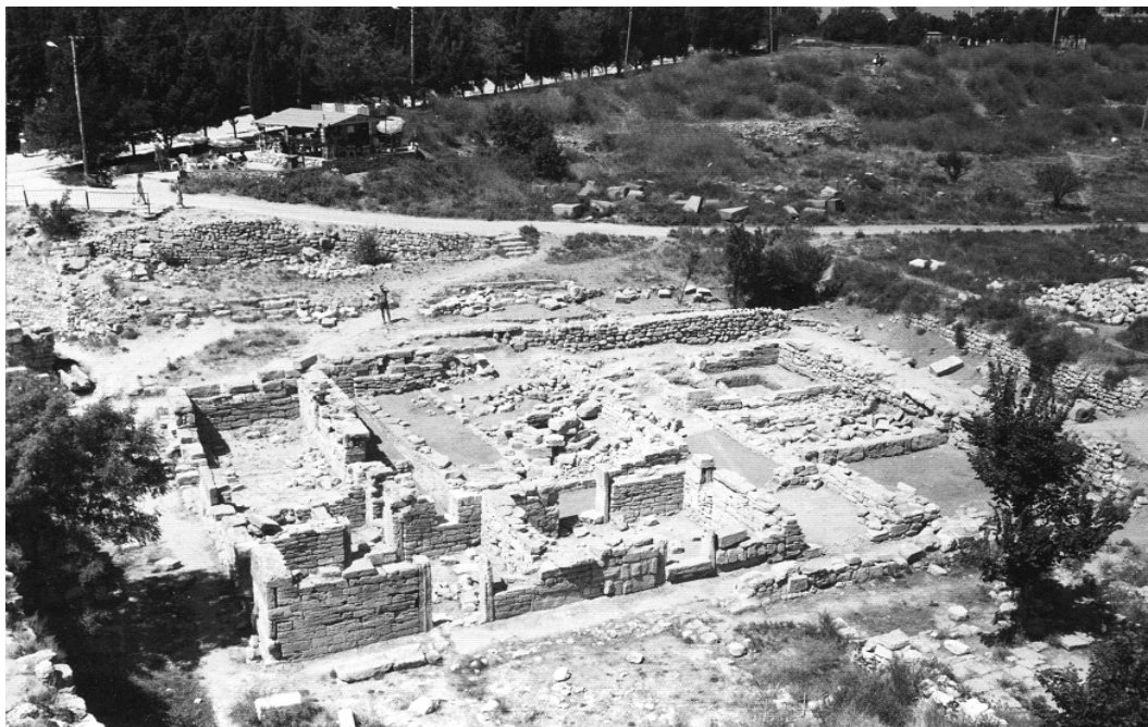
Рис. 10. «Казарма» после окончания работ (1998). Вид с башни XV

идеального полиса советовал возводить здания для сисситий граждан вблизи оборонительных стен, у моря (Arist. Pol. VII, 10, 1331a).