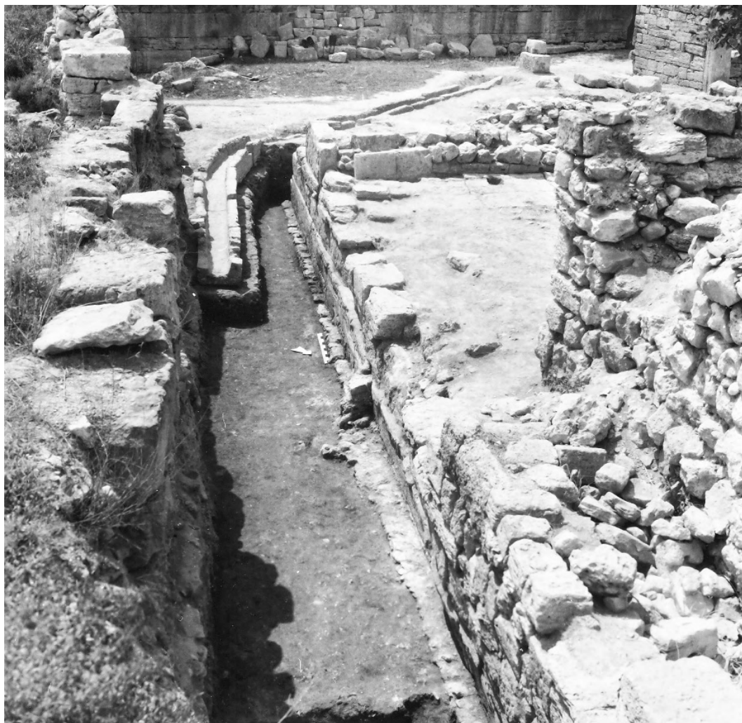
Рис. 9. XIV продольная улица после завершения работ (1993). Вид с севера