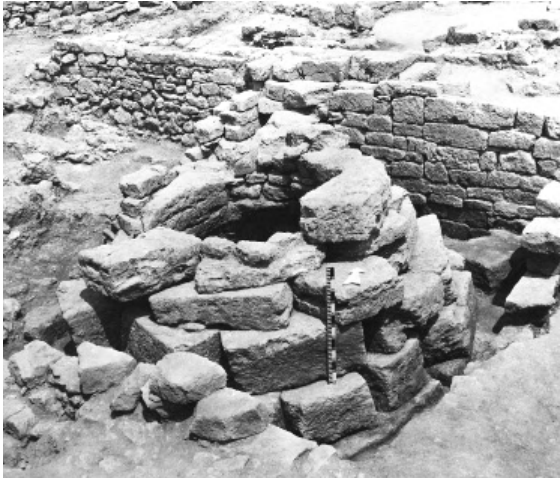
Рис. 7. Цистерна № 92 в «Центре казармы»

Деятельность Херсонесской археологической экспедиции Харьковского университета в 90-е годы прошлого столетия, на наш взгляд, получила достойное освещение в публикациях и научных отчетах [Приложения 1 и 2]. В этих работах опубликованы наиболее интересные находки, выделены основные периоды строительной истории участков «центр квартала» и «казарма» изложены основные итоги и выводы. Впрочем, следует согласиться с критическими замечаниями и пожеланиями относительно необходимости издания обобщающего монографического труда, посвященного, в первую очередь, исследованиям «казармы» [Приложение 1, 26, с. 357–365]. В любом случае, в данной публикации найдут отражение лишь краткие, обобщенные итоги нашей работы.