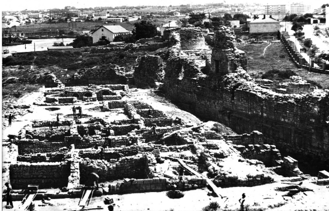
Рис. 1. Раскопки Портового района. Участки «Центр квартала» и «Казарма» (вторая половина 60-х)