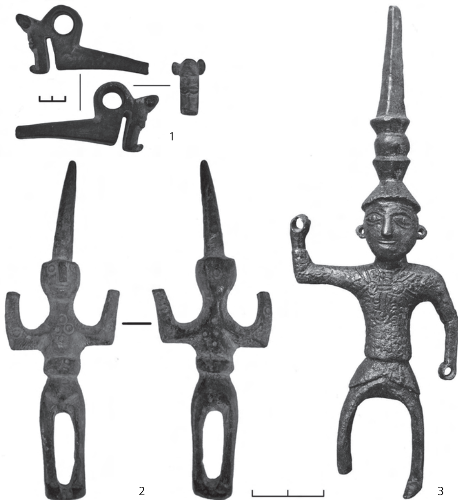
Рис. 2. Бронзовый амулет в виде волка (?) и антропоморфный подсвечник из восточного Крыма и его аналогия из Херсонеса:

1 — восточный Крым (фото А. В. Гаврилова); 2 — восточный Крым (фото А. В. Гаврилова); 3 — Херсонес (по: [17, с. 225, № 173]).