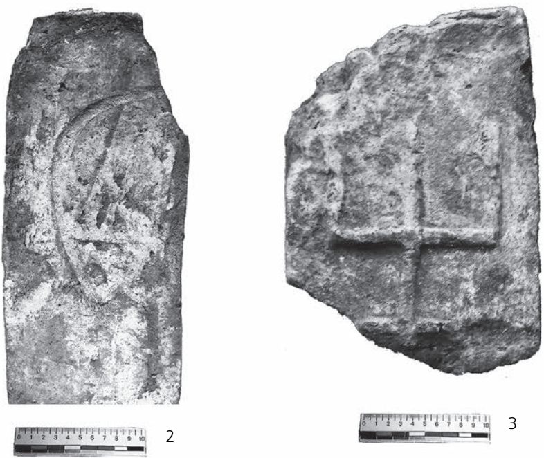
Рис. 1. Плінфи із знаками тризуба із зібрання НМІУ:

1 – НМІУ, інв. № в-4553/111. X ст. Київ, садиба М. Петровського (Володимирська 2). Розкопки В. В. Хвойки 1907 р.; 2 – НМІУ, інв. № в-4932; X ст. Київ, садиба М. Петровського (Володимирська 2). Розкопки В. В. Хвойки 1907–1908 рр.; 3 – НМІУ, інв. № в-5362. XII ст. м. Володимир-Волинський. 1990 р.