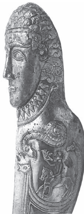
Фиг. 5а. Наколеникът(?) от Маломирово – Златиница, детайл [55, с. 67]