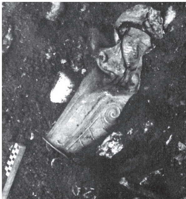
Фиг. 2а. Наколеникът(?) от Враца при откриването му [4, с. 59] Fig. 2a. The greave(?) from Vratsa as just discovered [4, с. 59]

ване да бъдат чифт 1 . Обстоятелството трябва задължително да се отчита, когато се правят опити за интерпретирането на четирите сребърни артефакта.