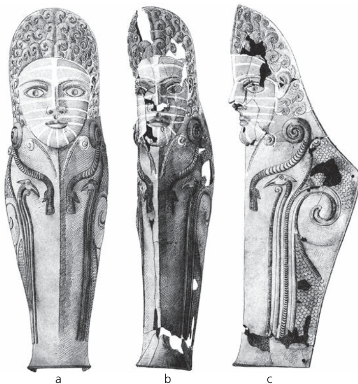
Фиг. 3. Наколеник(?) № 2 от Аджигьол [12, pl. 112]