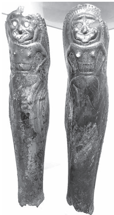
Фиг. 7. Наколенниците от Голямата Косматка