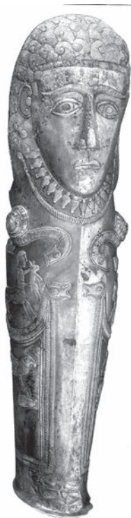
Фиг. 5. Наколеникът(?) от Маломирово – Златиница [19, р. 181]