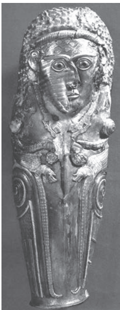
Фиг. 2. Наколеникът(?) от Враца [54, с. 248] Fig. 2. The greave(?) from Vratsa [54, с. 248]