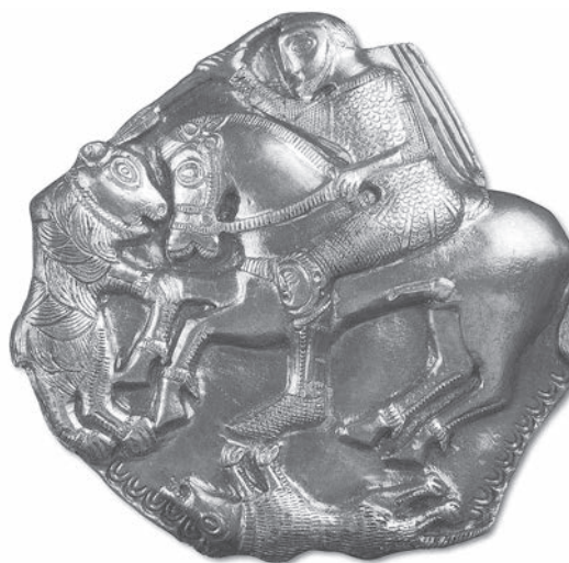
Фиг. 6. Апликацията от Летница [3, фиг. 15]