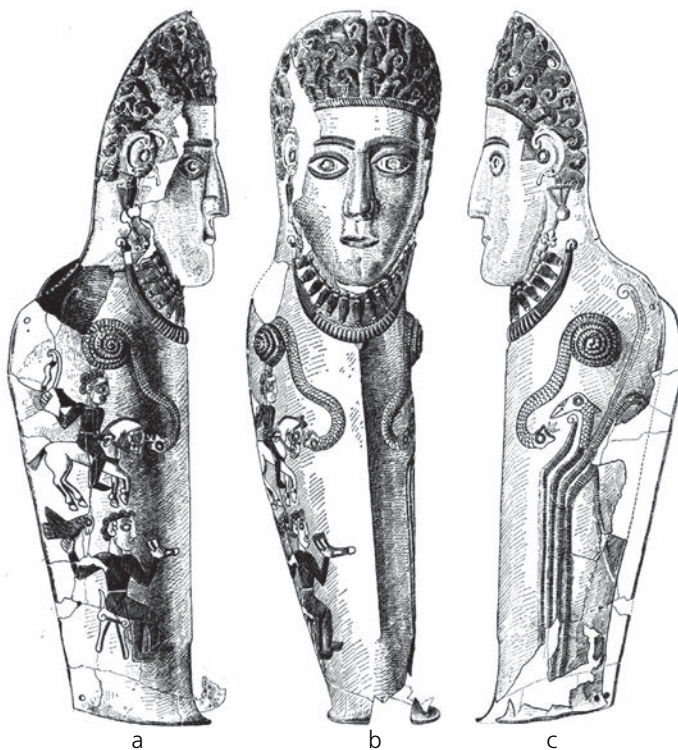
Фиг. 4. Наколенник(?) № 1 от Аджигьол [12, pl. 113]