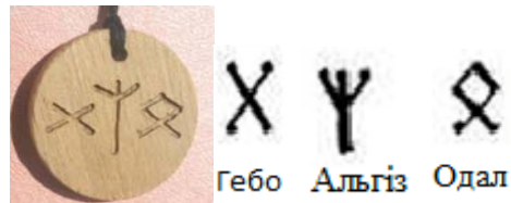
Рис. 2. Руни комунікації

Цікаво, що до складу сьомої групи футарку належать такі руни: