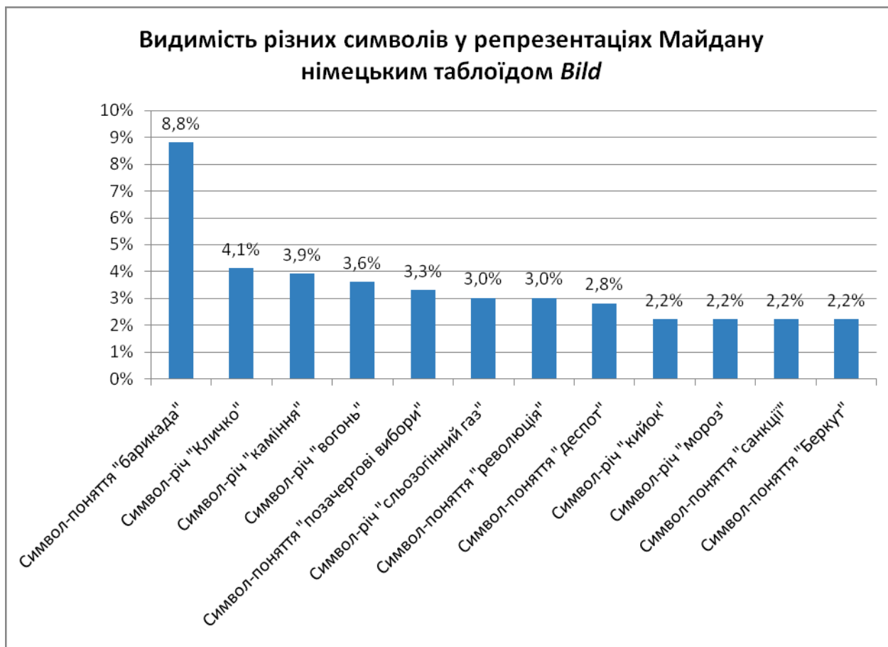
Рис. 1. Видимість різних символів у репрезентаціях Майдану в німецькому таблоїді Bild (N = 363)

Графік на рис. 2 показує видимість різних символів у загальній кількості ідентифікованих символів в аналітичному тижневику Der Spiegel у процентному відношенні. Він показує п'ять найбільш видимих символів. Решта символів використано лише один раз. Чотири із цих п'яти символів мають імпліцитне чи експліцитне значення насильства: