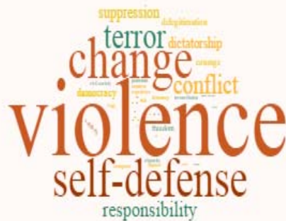
Рис. 4. "Хмара" найбільш видимих понять та ідей, виражених через символи в медіависвітленні Майдану німецькою пресою (N = 409)

адже репортери й редактори часто згадували про відповідальність влади за переслідування активістів, насильство "Беркуту" проти мітингувальників, розстріли "Небесної Сотні".