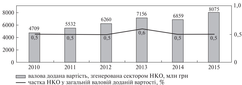
Рис. 3. Позиціонування сектору некомерційних організацій у валовій доданій вартості в Україні