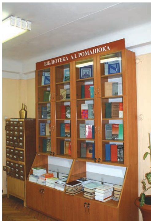
Частина наукової бібліотеки А. Романюка, подарована Інституту демографії та соціальних досліджень імені М.В. Птухи НАН України

У 1998—2004 рр. доктор Романюк як радник від канадського уряду брав участь у всіх основних стадіях підготовки й проведення Всеукраїнського перепису населення 2001 року. Від імені канадського уряду він дав техніко-економічне обґрунтування й оцінку канадської допомоги у