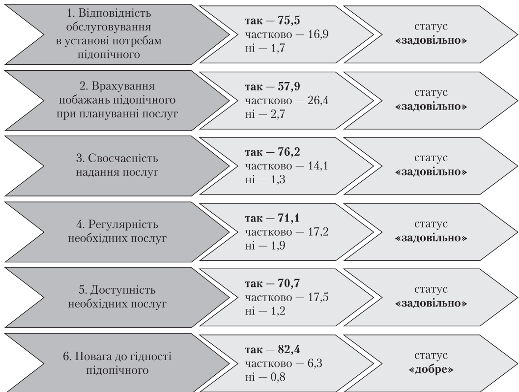
Рис. 2. Розподіл відсоткових еквівалентів і відповідних статусів за окремими показниками забезпечення якості обслуговування