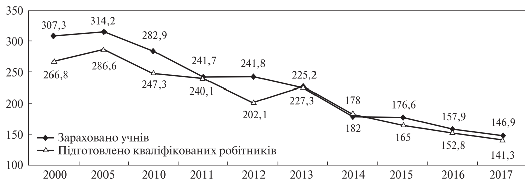
Рис. 1. Динаміка показників роботи професійно-технічних навчальних закладів, тис. осіб

Протягом 2000–2017 років професійно-технічна освіта функціонувала в умовах фінансових обмежень порівняно зі зростанням фінансових ресурсів в освітню галузь у цілому. Загальні видатки зведеного бюджету в освіту підвищились з 14,7 % до 16,8 %. У професійно-технічну, навпаки, зменшились із 0,9 % до 0,8 %. Найбільше зросло фінансування загальної середньої освіти: з 2000 до 2017 року майже на 51 % [9]. Фінансові вливання в загальну середню освіту не пов'язані з навчанням учнів професійних навичок із метою полегшення їх працевлаштування після закінчення середньої школи (рис. 3).