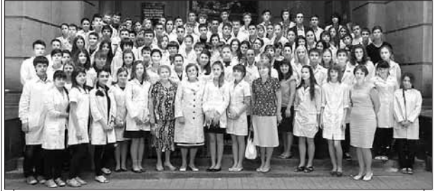
Колектив медичного ліцею „Дніпро”