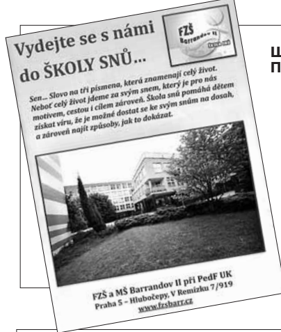
Школа Баррандов Праги 5