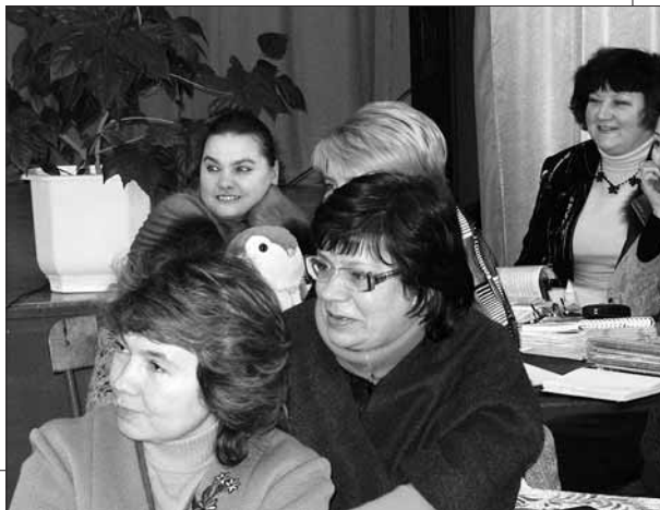
Члени педагогічного колективу

Усі центри УС „ДАРУС” є добровільними об'єднаннями учнівської молоді, що формуються один раз на два роки з числа учнів закладу. Кожний із них протягом навчального року контролює певну ділянку роботи. На основі досягнутих результатів учнями й учнівськими колективами Рада школи за участю адміністрації закладу, батьківського комітету та координаторів із числа педпраців-