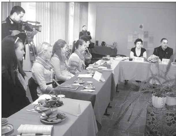
Моніторинг залучення активної молоді до "ДАРУС"