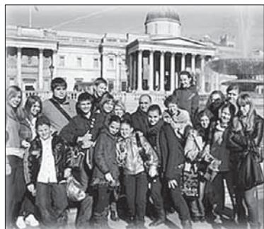
Учні гімназії №11 під час навчання в Golders Green College в м. Лондон, Великобританія, 2013 р.

Директор комунального закладу „Спеціалізована школа з поглибленим вивченням іноземних мов І ступеню – гімназія №11 м. Дніпродзержинська” Дніпропетровської області