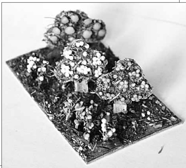
Мал. 5. Приклад-зразок лісу – елементу гри „Садіба”