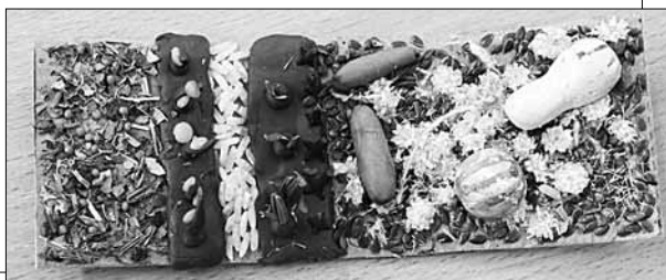
Мал. 2. Приклад-зразок колодязя – елементу гри „Садиба”