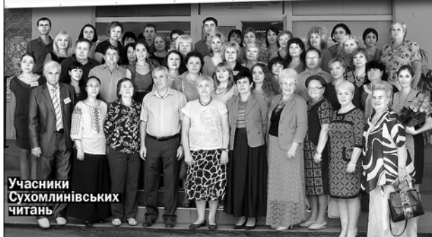
Учасники Сухомлинівських читань

етичних бесід за творами В.О.Сухомлинського, класні керівники проводять години спілкування, години роздумів, духовності, доброти: «Добро і милосердя через усе життя», «Духовні цінності в моєму житті», «Посій добро і подаруй любов» тощо. А також підтримують традиції, закладені самим В.О.Сухомлинським: робота в Саду Матері, шкільній теплиці, навчально-дослідних ділянках; святб хліба, природи, доброти, рідної мови та ін.