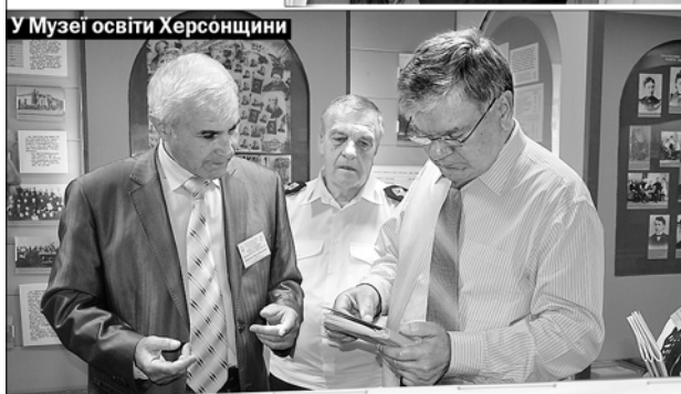
У Музеї освіти Херсонщини