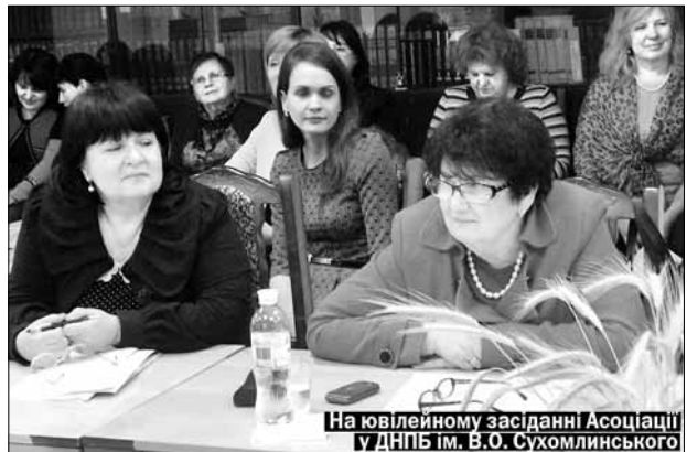
На ювілейному засіданні Асоціації у ДНПБ ім. В.О. Сухомлинського