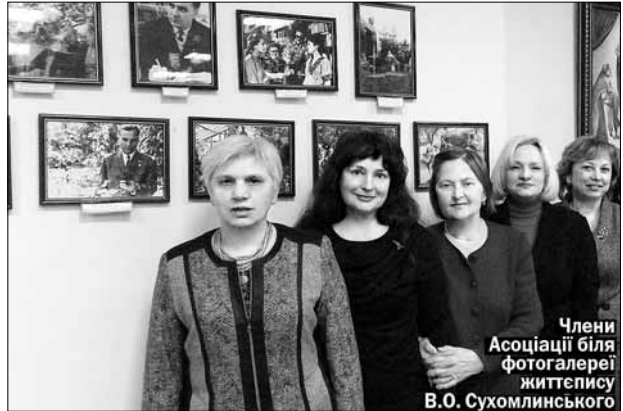
Члени Асоціації біля фотогалереї життєпису В.О. Сухомлинського