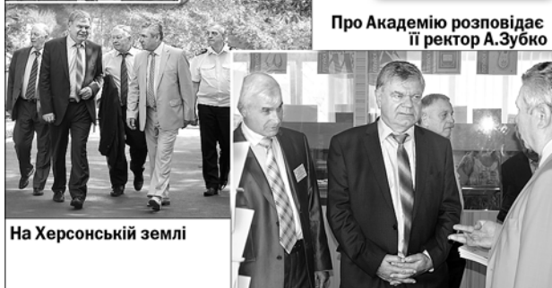
На Херсонській землі