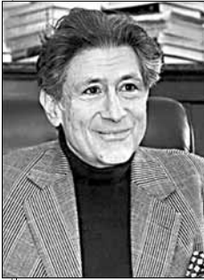
Едвард Ваді Саїд (1.11.1935 — 25.09.2003) — американський літературний критик палестинського походження. Основоположник постколоніальної теорії. Професор англійської літератури й компаративістики в Колумбійському університеті, президент Асоціації сучасних мов.