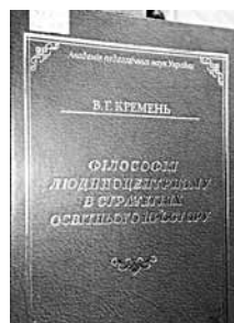
Філософія людиноцентризму в стратегіях освітнього простору