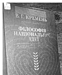
Філософія національної ідеї