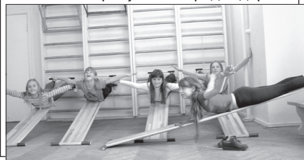
Тренування заради здоров'я