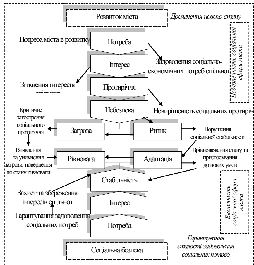
Рис. 2. Декомпозиція складових категоріального апарату соціальної безпеки міста [19, с. 30; 20, с. 24 – 25]

Узагальнюючи викладені міркування, можна стверджувати, що охарактеризовані поняття, які було наведено вище, взаємопов'язані. У своїй єдності вони характеризують процес розвитку міста і його соціального забезпечення (рис. 2).