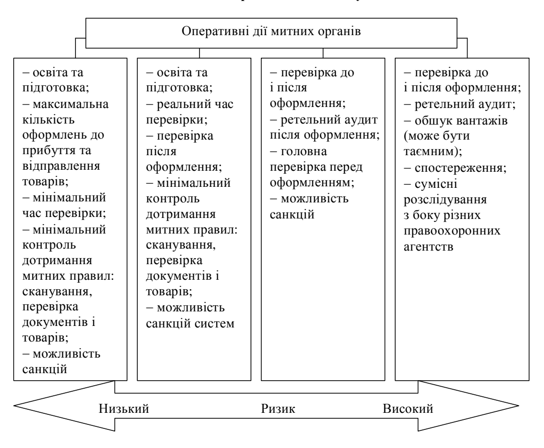
Рис. 2. Структура оперативних дій митних органів відповідно до рівня ризику