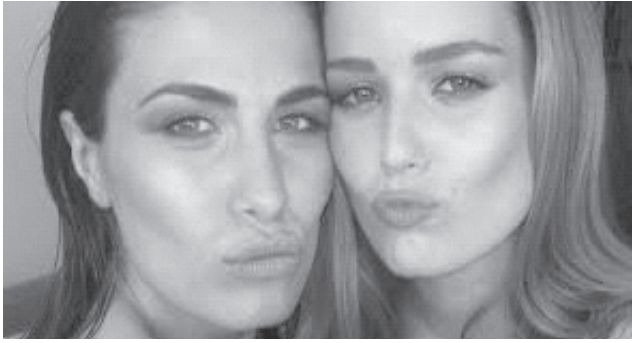
Однотипная гримаса в форме преднамеренного хоботкового (призывного) выпячивания губ («уточка»)

девиация, при которой половое влечение испытывается к самому себе. Может рассматриваться как разновидность фетишизма. Как известно, название произошло от героя греческой мифологии Нарцисса, который, согласно легенде, увидев в воде своё отражение, был им очарован и, не в силах оторваться от созерцания своей красоты, умер от любви к самому себе.