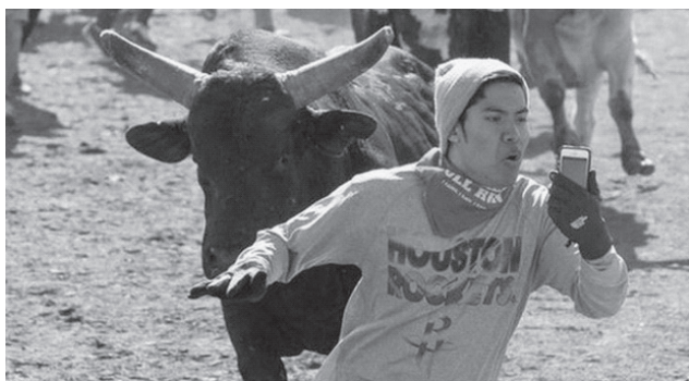
Молодой человек на этом фото смог сделать селфи с бегущим за ним быком