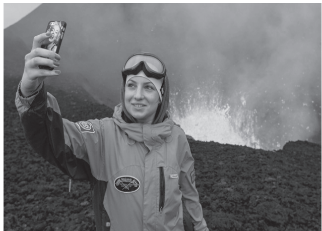
Опасное селфи у вулкана.