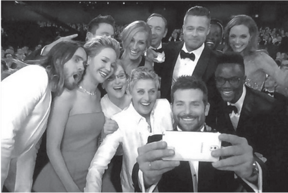
Знаменитое селфи голливудских звезд на церемонии вручения «Оскара».

Распространенность селфи относят также, в большой степени, как к современной и новой, очень модной молодежной субкультуре, степень увлеченности которой ассоциируется с психологическими особенностями респондентов (источник: http://www.libozersk.ru/pages/index/343?cont=1 ).