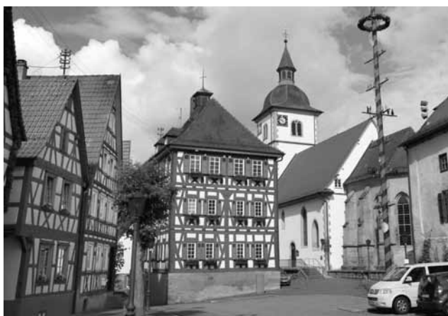
Книтленген. Дом, в котором родился И. Фауст