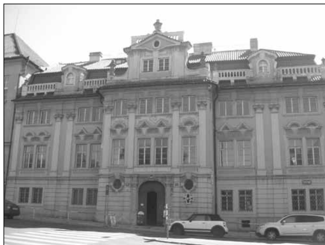
Дом Фауста. Прага, Чехия.

Упоминает о Фаусте и Мартин Лютер. «Когда еще был жив реальный Фауст, Лютер выступил с первыми заявлениями, в которых маг Фауст был объявлен пособником дьявола» [2, с. 153]. В книге «Застольные беседы Мартина Лютера» упоминается несколько раз о Фаусте. Когда однажды за ужином зашла речь о некоем чернокнижнике Фаусте, доктор Лютер сказал внушительно: «Противоборствуя мне, дьявол не прибегает к помощи колдунов. Если бы он мог этим нанести мне вред, он бы давно уже сделал это. Не раз уже он хватал меня за глотку, но приходилось ему все-таки отпустить меня. Я-то уж по опыту знаю, ка-