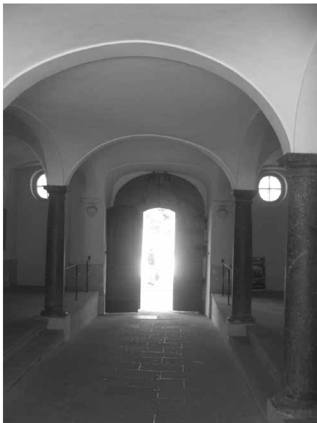
Дом Фауста. Вестибюль. Прага, Чехия.

«В вюртембергскую деревню он приехал под вечер в какой-то праздник. Был он удручен и совсем болен, ибо пришел уже час, назначенный ему дьяволом в договоре. Видит он, что на постоялом дворе шумят пирующие крестьяне, просит поэтому хозяина отвести ему отдельную каморку. Крестьяне же кричат все сильнее, и просит тогда Фауст, чтобы они уважили его, как больного, и были потише. А они давай шуметь еще пуще, как это всегда бывает, если мужика о чем попросишь. Тогда Фауст в последний раз применил свои чары и всем им так раздвинул челюсти, что они сидят и плят глаза друг на друга, а слова вымолвить никто из них не может. Знаками указывают на комнату постояльца, чтобы хозяин попросил его снова закрыть им рты. Фауст соглашается при условии, что они впредь шуметь не будут. После этого они поспешно уходят. В полночь хозяин услышал грохот в комнате постояльца, а наутро он увидел, что у Фауста шея свернута, а голова свисает с кровати» [цит. по 11, с. 28]. Это место идентифицируется сегодня, как Штауфен-им-Брайсгау (земля Баден-Вюртенберг). Точный год его смерти не известен. Но большинство исследователей относят ее примерно к 1540 году. Таковы основные вехи жизни Фауста. Но что же представлял собой Фауст, как человек.