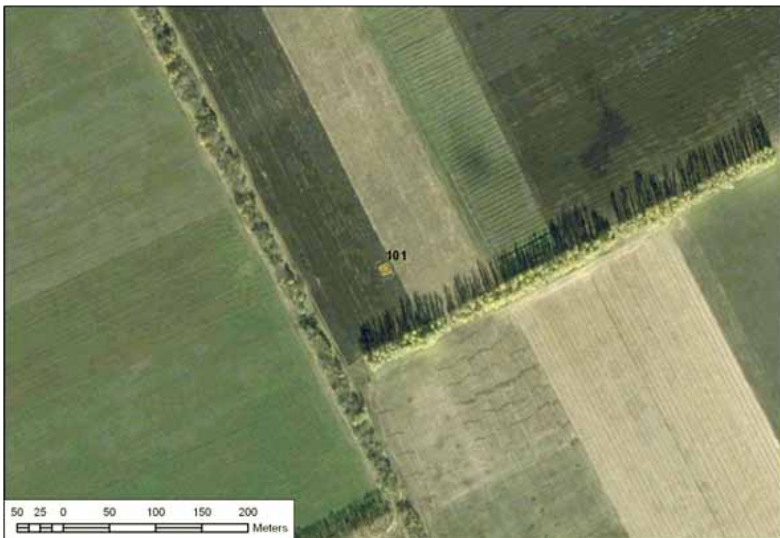
Рис. 4. Приклад правильної рекультивації свердловини