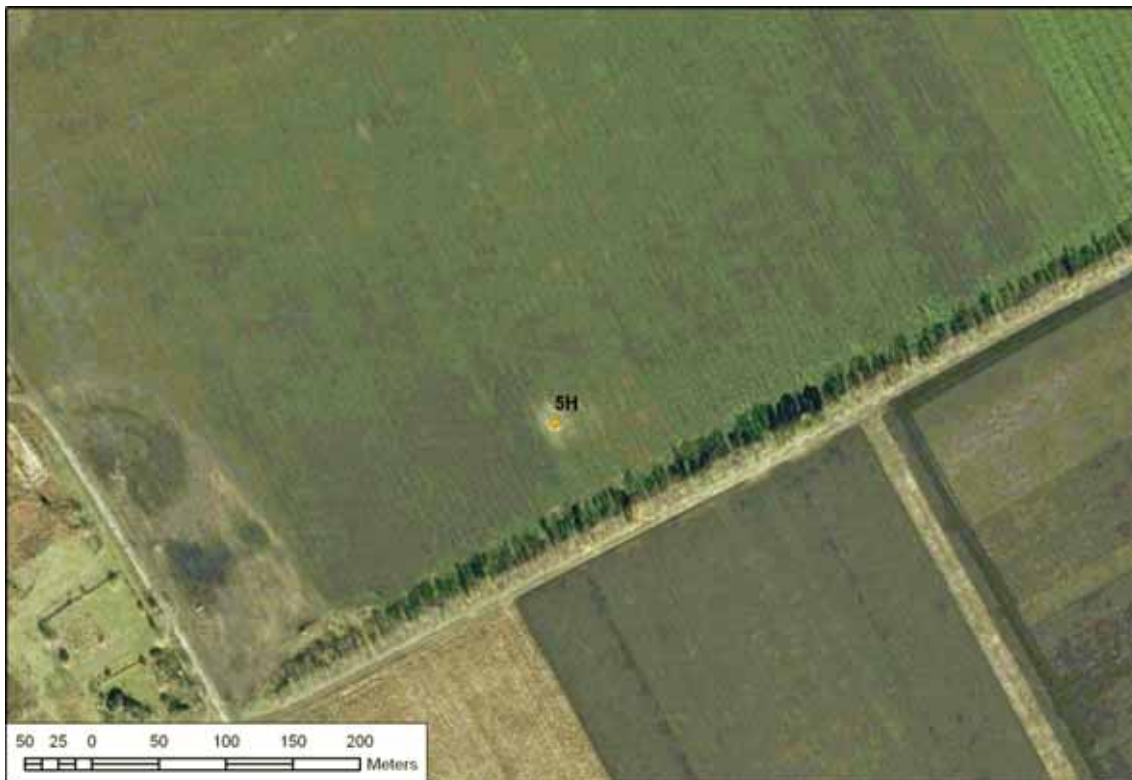
Рис. 3. Ділянка розвідувальної свердловини № 5H