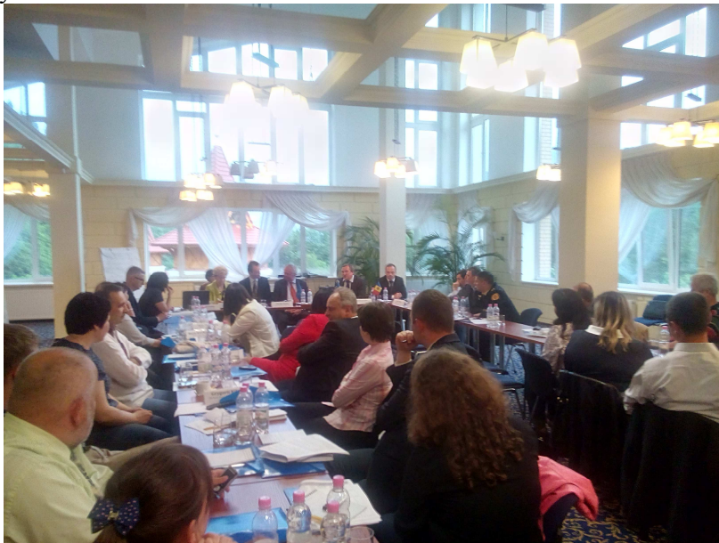
Рис. 1. Конференція у м. Яремче 26 червня 2015 р.

Державною службою статистики України, Адміністрацією Карпатського національного природного парку.