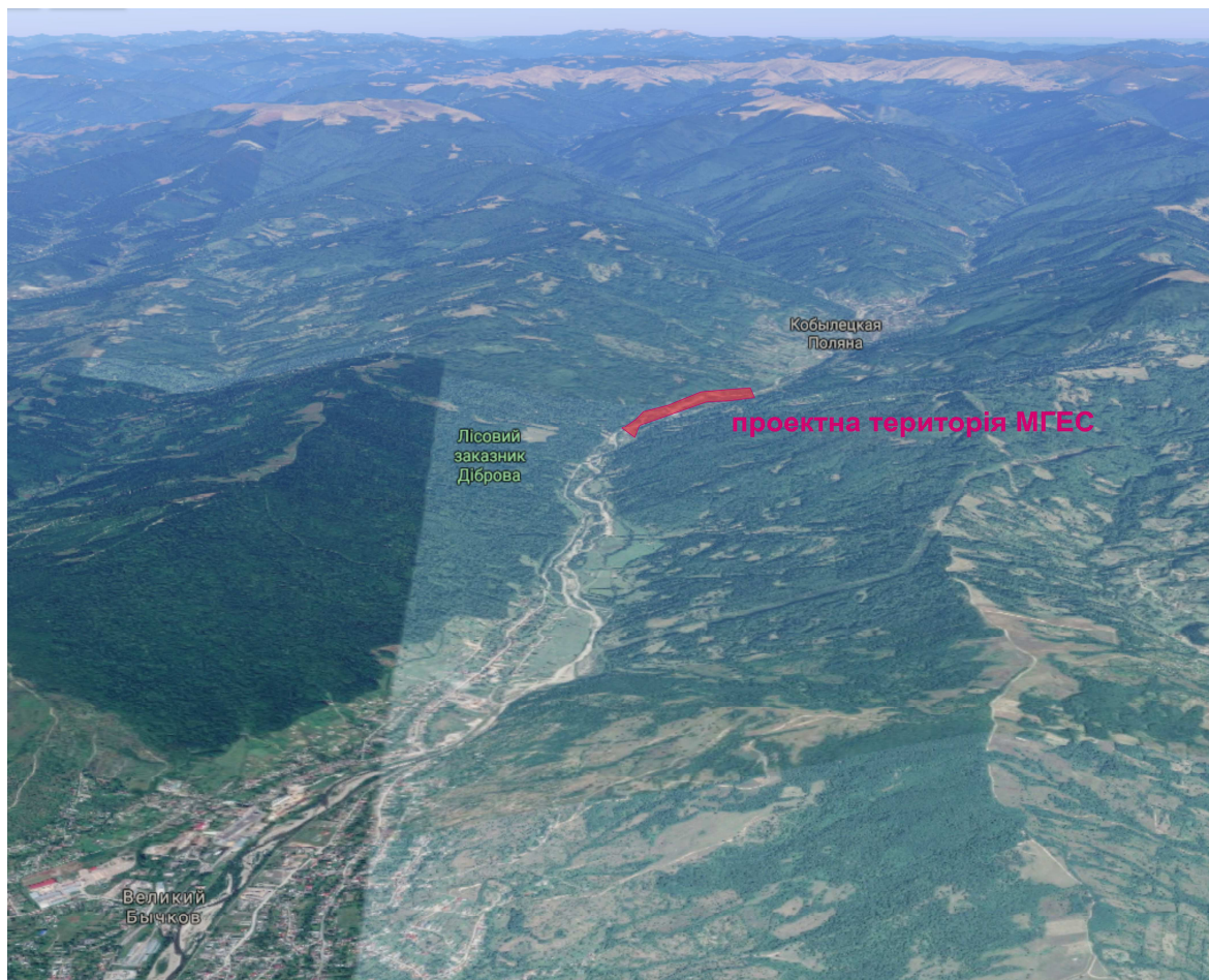
Рис. 1. Проектна територія МГЕС на р. Шопурка

Русло річки слабозвивисте, помірно розгалужене. Острови й осередки зустрічаються через кожні 5–8 км; довжина їх 3–60 м, ширина 15–20 м, висота 0,4–0,8 м, в паводки затоплюються. Складені вони суглинками або гальковиком, задерновані, деякі із них заросли рідким чагарником і окремими деревами. Протоки й рукави, які відділяють острови й осередки, довжиною 20–230 м, шириною 0,3–3,0 м, глибиною 0,1–0,3 м, швидкість течії в них 0,5–0,9 м/сек [1].