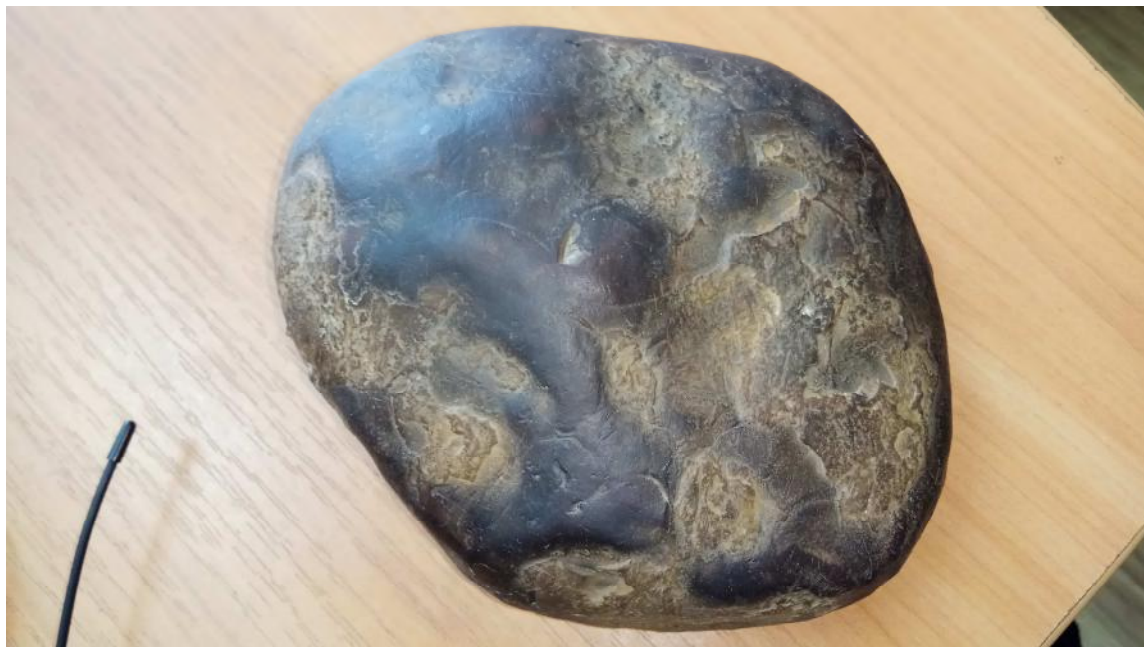
Рис. 7. Загальний вигляд метеорита

Вчені підраховали, що ймовірність зіткнення астероїда з Землею складає один на 10 млн років. Але коли відбудеться така подія складно прогнозувати: через мільйон років чи завтра. Нині діє служба стеження за астероїдами, яка контролює уже більше сотні їх.