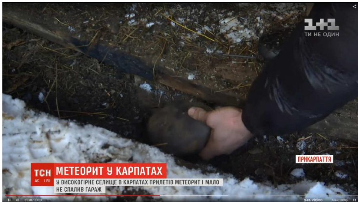
Рис. 4. Метеорит пробив підлогу і заглибився в землю