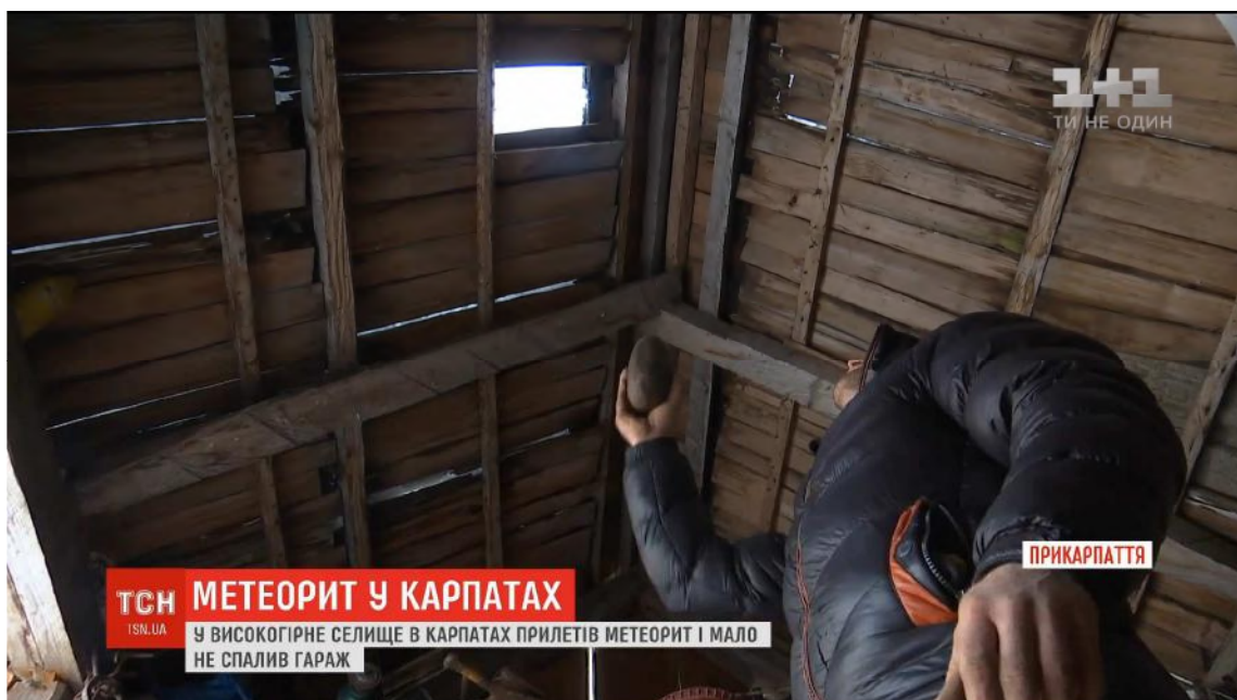
Рис. 3. Отвір у даху, пробитий метеоритом