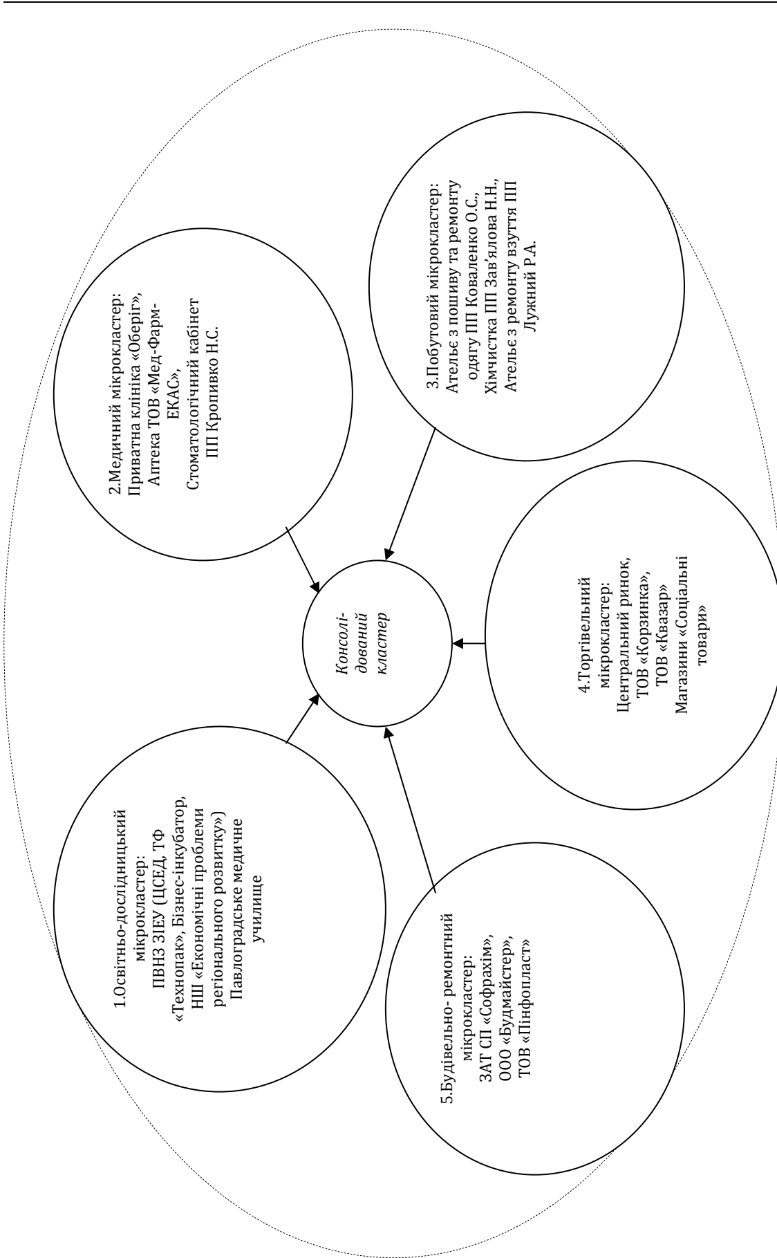
Рис. 1. Склад учасників консолідованого кластера Західнодонецького регіону