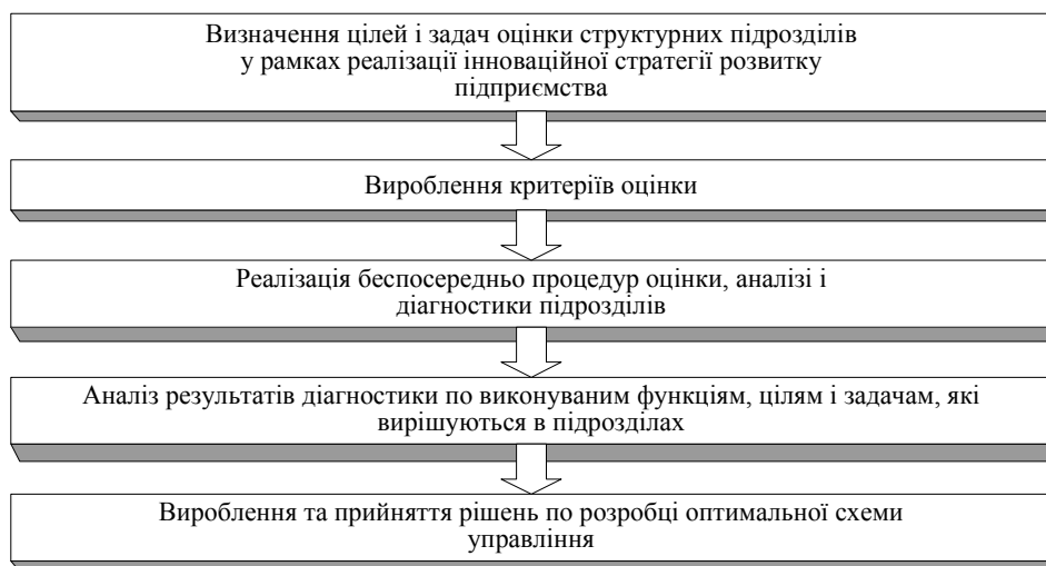
Рис. 1. Послідовність етапів процесу побудови організаційної моделі управління ефективністю структурних підрозділів підприємства

виконання досліджуваними підрозділами їх функцій, тим цілям і завданням, які вони покликані вирішувати.