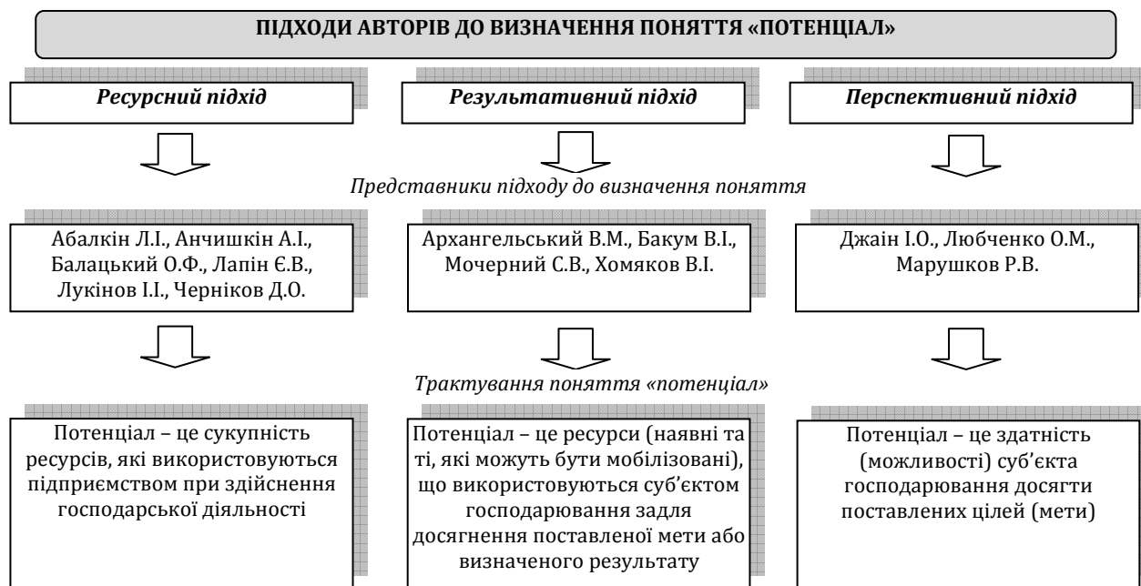
Рис. 1. Підходи авторів до визначення сутності поняття «потенціал»

Отже, проведений аналіз поглядів щодо трактування потенціалу дозволив виділити наступні основні підходи авторів до визначення сутності поняття «потенціал» (рис. 1).