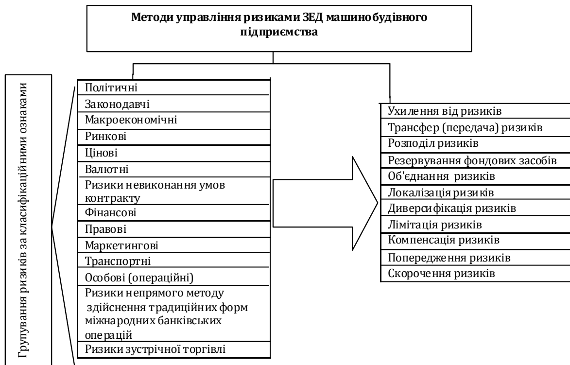
Рис. 3. Методи управлінської дії на ризики традиційних форм ЗЕД машинобудівного підприємства

зовнішньоторговельної угоди, що визначає ступінь матеріальної відповідальності сторін за виконання зобов'язань, тому висококваліфіковане його оформлення дозволяє звести ризик певної угоди до мінімуму і визначити при виникненні суперечок між контрагентами їх обов'язок. З метою зниження юридичних ризиків при укладенні зовнішньоторговельної угоди машинобудівне підприємство повинне зазначити, що у разі виникнення суперечок питання, не врегульовані контрактом, вирішуються за українським законодавством. Це створює певні переваги і дозволяє уникнути зайвих валютних витрат у ситуаціях, коли доведеться звертатися в судові органи для вирішення конфлікту [1; 5].