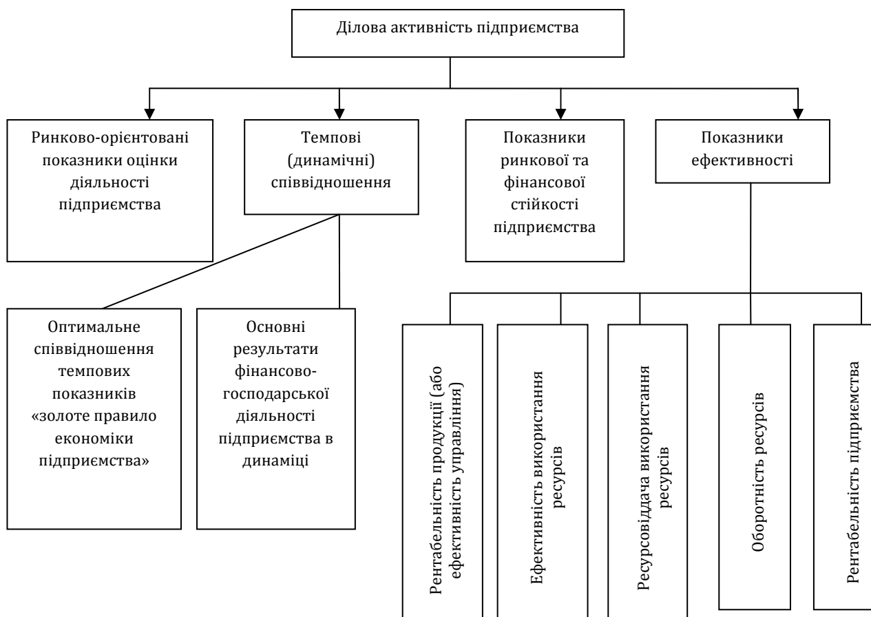
Рис. 1. Розгорнута схема аналізу ділової активності підприємства*

Група темпових коефіцієнтів аналізу ділової активності налічує 2 основних складових: набір абсолютних показників, які складають «золоте правило економіки підприємства», та сукупність динамічних коефіцієнтів зміни основних результатів фінансово-господарської діяльності підприємства.