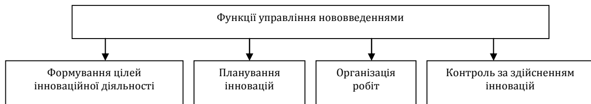
Рис. 1. Функції управління нововведеннями на підприємстві

діяльності, забезпечення інновацій інвестиціями, попередження технологічного відставання, упровадження нових винаходів та розробок у взаємопов'язаних сферах діяльності, аналіз результативності здійснення інноваційної діяльності.